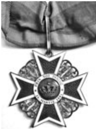
Ordinul „Coroana României” în gradul de Comandor (avers și revers)