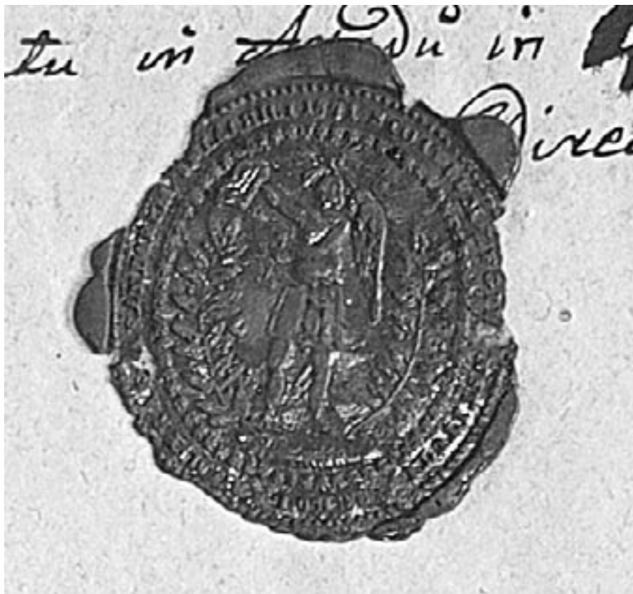
Fig. 1. Sigiliul Institutului Regal al Școlii Preparandiale Române, (1841)

Cele două vestigii sigilare școlare arădene prezentate mai sus transmit într-un fel aparte acea emotivitate ce leagă generațiile, trezește interesul pentru interpretarea corectă a reprezentării din emblemă și reține atenția prin simbolurile reprezentate.