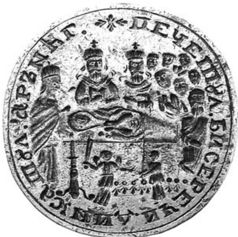
Fig. 2. Tiparul sigilar al Bisericii „Adormirea Maicii Domnului”, din satul Arăneag