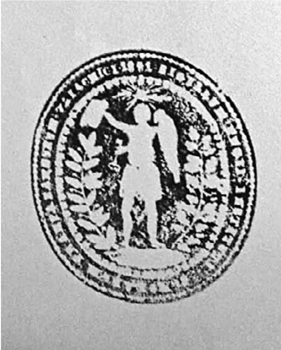
Fig. 2. Sigiliul Institutului Regal al Școlii Preparandiale Române, (1841)