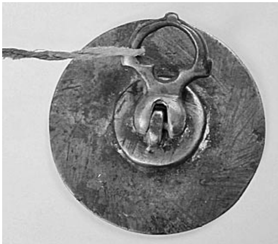
Fig. 2. Mănerul tiparului