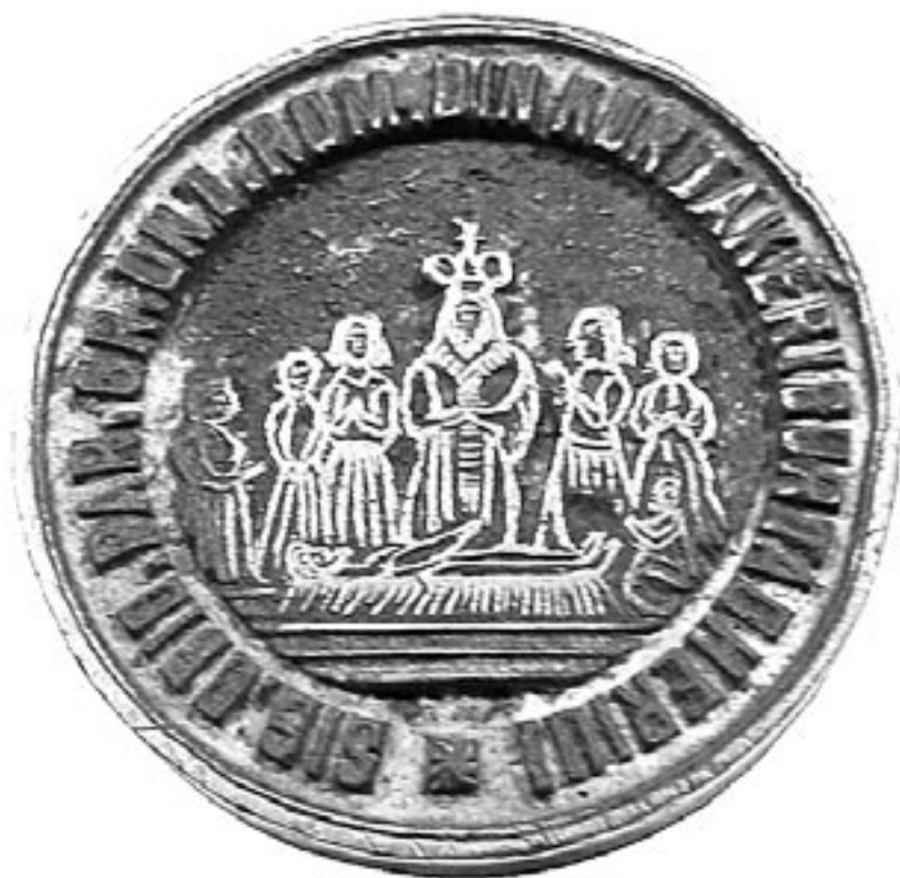
Fig. 4. Tipar sigilar al Bisericii „Adormirea Maicii Domnului” din Chier