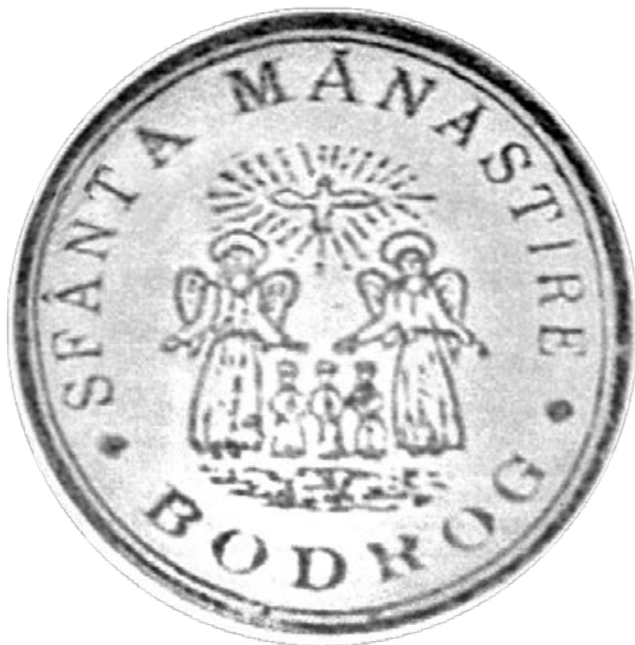
Sigiliul Mănăstirii Bodrog