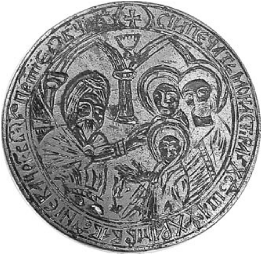
Fig. 1. Tipar sigilar al Mănăstirii Hodoș-Bodrog