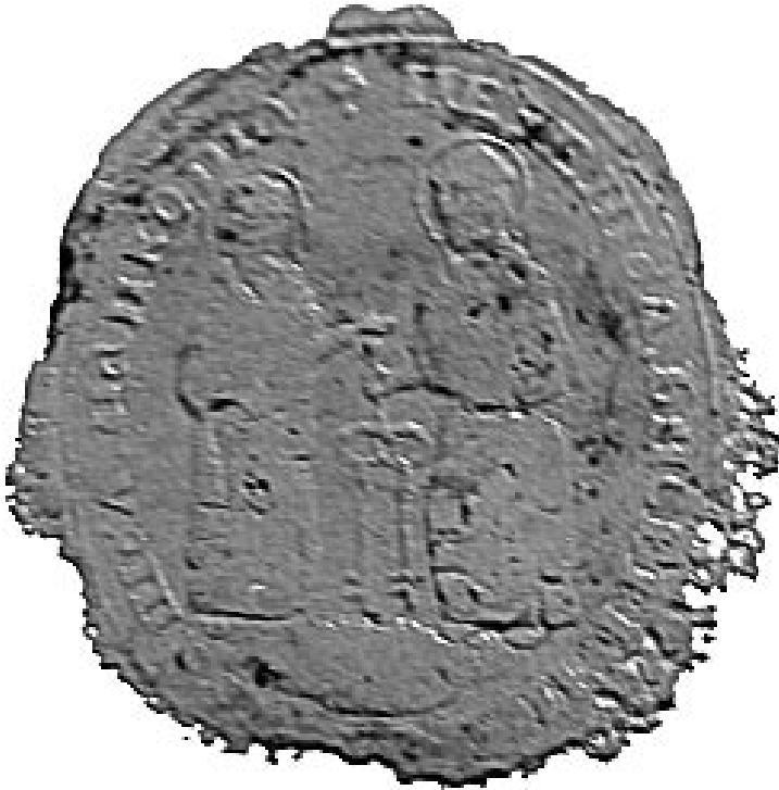
Fig. 1. Sigiliul Bisericii „Sf. Apostoli Petru și Pavel” din Pâncota

Știm că analiza realizată este parțială, deoarece nu cuprinde toate vestigiile sigilare ale bisericilor din protopopiatul Șiria, ele nefiindu-ne încă cunoscute, dar o cercetare metodică a fondurilor documentare aflate în arhive, muzee sau colecții particulare, pe care sunt conservate sigilii ale acestor vechi biserici, o va putea întregi.