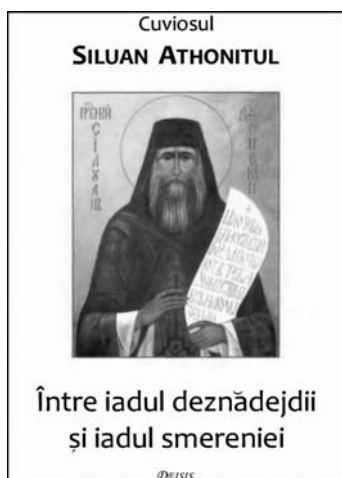
Între iadul deznădejzii și iadul smereniei

(Sfântul Siluan Athonitul, Între iadul deznădejzii și iadul smereniei , Editura Deisis, Alba Iulia, 1994, p. 143)